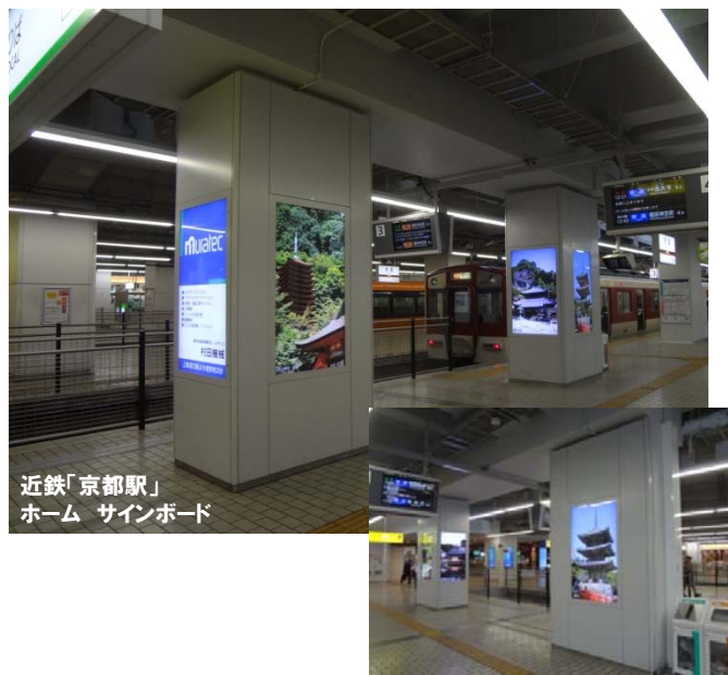
近鉄「京都駅」 ホーム サインボード