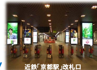
近鉄「京都駅」改札口

朝夕の通勤で利用するビジネスマンや学生に、じっくり浸透させたり、多方面からの観光客に、インパクトのある告知やブランディングなど多様なターゲットに多彩な表現が可能です。