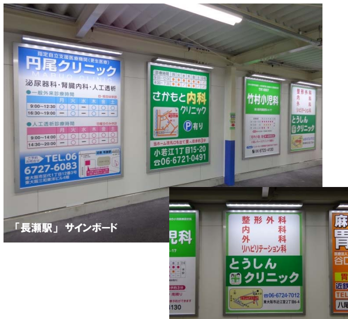
「長瀬駅」サインボード