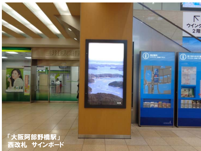
「大阪阿部野橋駅」 西改札 サインボード