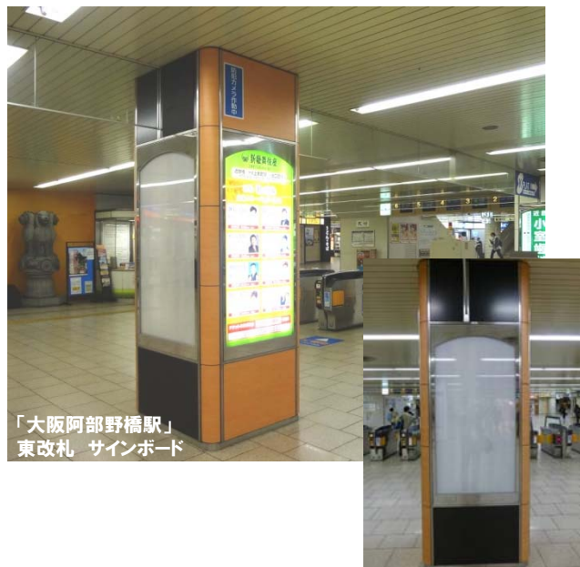
「大阪阿部野橋駅」 東改札 サインボード