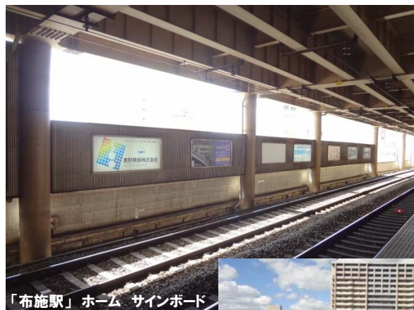
「布施駅」ホーム サインボード