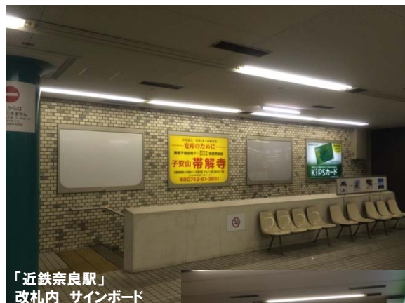
「近鉄奈良駅」 改札内 サインボード