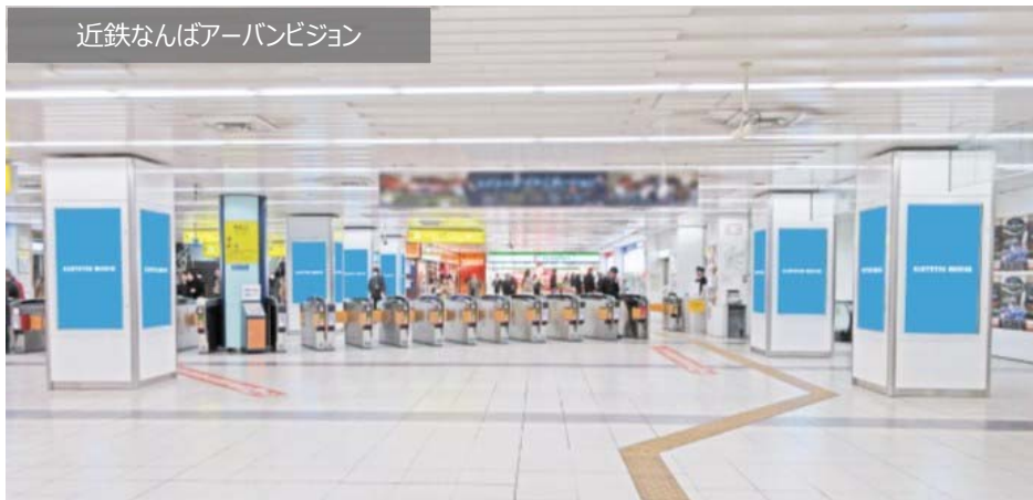
近鉄なんばアーバンビジョン