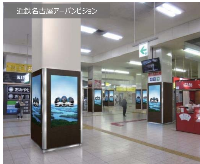
近鉄名古屋アーバンビジョン